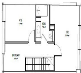
NIVEAU R+1 - 1/100e

Un espace de bureau de 8,70 m 2 Chambre 1 d'environ 13,80 m 2 Chambre 2 d'environ 9,50 m 2 Une salle d'eau avec WC d'env 5,00 m 2