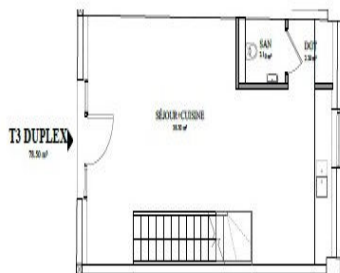
NIVEAU RDC - 1/100e

Séjour / Cuisine d'environ 37,20 m 2 Un dégagement d'environ 2,20 m 2 Un WC indépendant d'environ 2,10 m 2 Un escalier accès étage