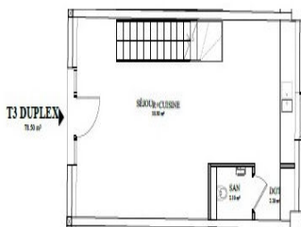
NIVEAU RDC - 1/100e

Séjour / Cuisine d'environ 37,20 m 2 Un dégagement d'environ 2,20 m 2 Un WC indépendant d'environ 2,10 m 2 Un escalier accès étage