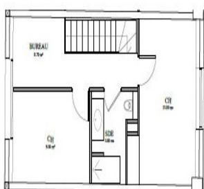
NIVEAU R+1 - 1/100e

Un espace de bureau de 8,70 m 2 Chambre 1 d'environ 13,80 m 2 Chambre 2 d'environ 9,50 m 2 Une salle d'eau avec WC d'env 5,00 m 2