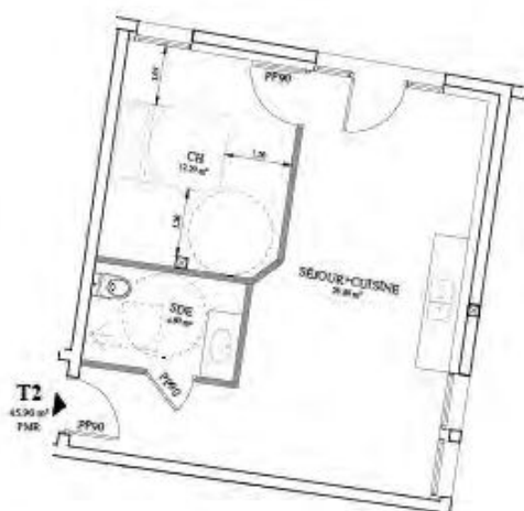
NIVEAU RDC - 1/100e

Une salle d'eau avec WC d'environ 4,80 m 2