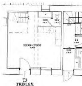
NIVEAU RDC - 1/100e

Séjour / Cuisine d'environ 26,30 m 2 Un dégagement d'environ 2,00 m 2 Un WC indépendant d'environ 1,30 m 2 Un escalier accès étage